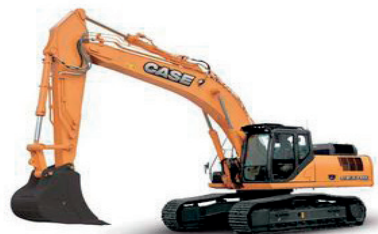
Pelles sur chenilles De 1 à 120 Tonnes