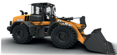
Chargeuses sur pneus De 6 à 30 Tonnes